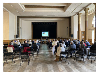
La salle des Fêtes pour la conférence de M. Félix Laffé

M. Félix LAFFÉ , documentaliste retraité aux archives départementales des Bouches-du-Rhône, membre correspondant de l'Académie, a tenu une conférence, richement illustrée, sur le thème « Du moulin à contrepoids à la chaîne continue : l'huile d'olive en terre des Baux de 1416 à nos jours ».