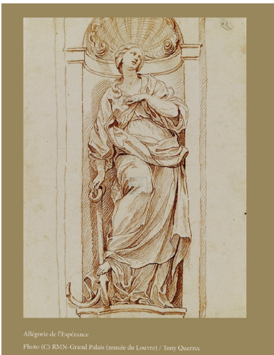
Allégorie de l'Espérance