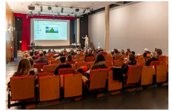
L'auditorium du MdAa bien rempli

Les Actes de ces journées seront publiés dans la collection des Travaux de l'Académie d'Arles .