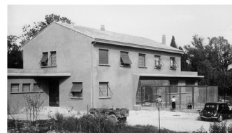
La Tour du Valat