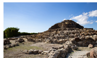
Le nuraghe de Burimimi (Sardaigne)